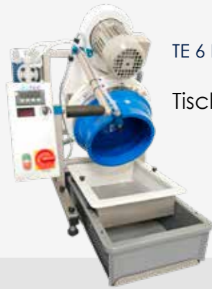
TE 6 HD