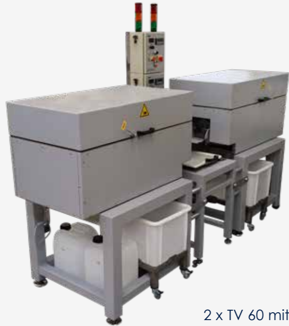
2 x TV 60 mit manueller Separierung