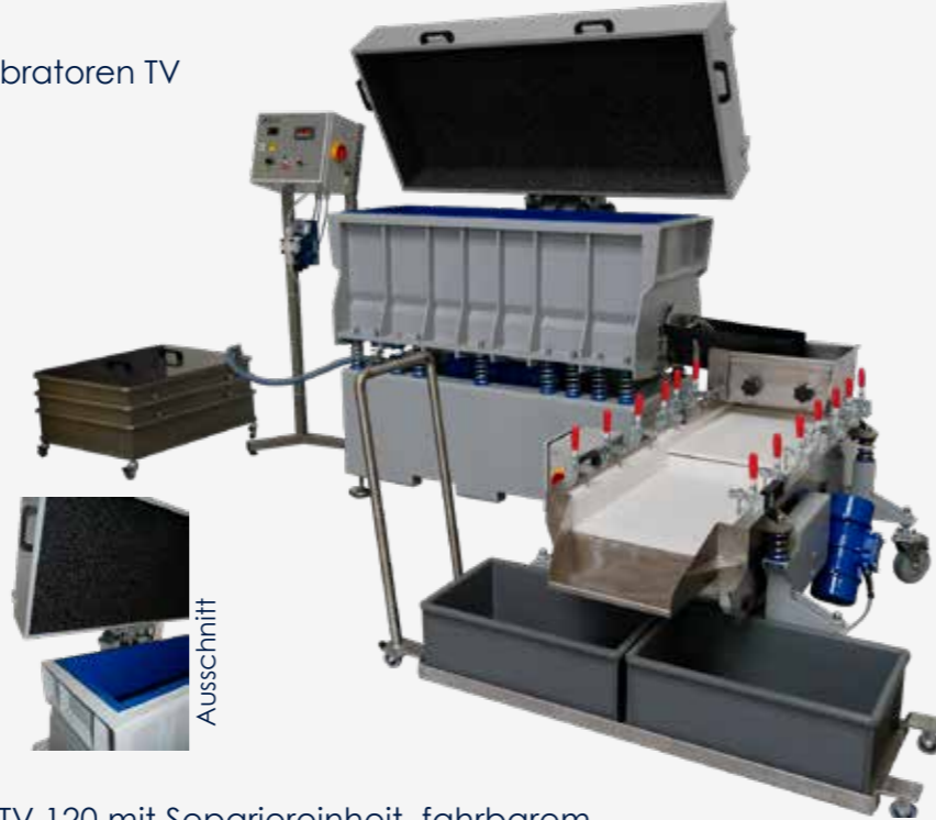
TV 120 mit Separiereinheit, fahrbarem Mediacontainer und Kaskade zur Abwasserreinigung