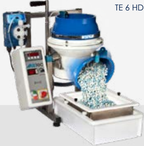
TE 6 HD

Werkstücke und Schleifmittel werden lose in einen oben offenen Arbeitsbehälter gegeben und durch den als Teller ausgebildeten Boden in eine torusförmige Strömung versetzt. Die Zentrifugalkraft beschleunigt die Werkstücke zusammen mit den Schleifkörpern an die stehende strömungsgünstige Innenwand des Arbeitsbehälters. Aufgrund ihrer unterschiedlichen Dichte führen Werkstück und Schleifkörper dabei eine Relativbewegung aus. Diese dynamische Strömung ermöglicht einen hohen, gezielten Materialabtrag mit sehr kurzen Bearbeitungszeiten im Vergleich zu Vibratoren oder Trommeln.