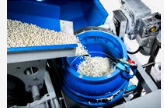
TE 60 A 2-Chargensystem mit Separiereinheit