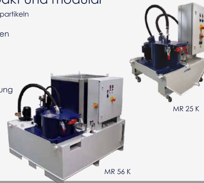
MR 56 K